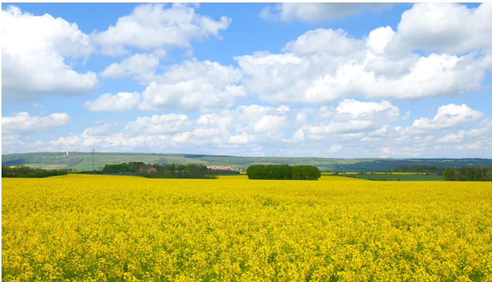
Rapsfelder südlich vom Ettersberg 20.05.2021, Mahnmahl links am Horizont

Erdgas ist fossil und erzeugt durch die Verbrennung CO 2 und Feinstaub, Holz erzeugt bei seiner Verbrennung und gleicher Energieabgabe die gleiche CO 2 -Menge und auch Feinstaub aber die 2000-fache Menge. „Die Feinstaubemissionen aus Holzfeuerungsanlagen überstiegen nach einer Untersuchung des Umweltbundesamtes die Emissionen aus dem Straßenverkehr (nur Verbrennung) von 22.700 Tonnen“ 2) . Warum stellt man nun die Verbrenner als Beelzebub dar und pocht auf E-Mobilität, was ist mit dem Reifenabrieb, Bremsstaub usw., und der bleibt doch gleich? Warum schränkt man nicht die Holzverbrennung ein, die nur in geringem Maße minderwertiges Holz verwendet und die Wälder weltweit vernichtet.